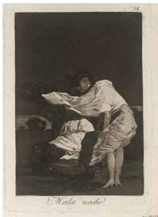
Francisco de Goya, Mala noche , 1799 Eau-forte et aquatinte sur vergé