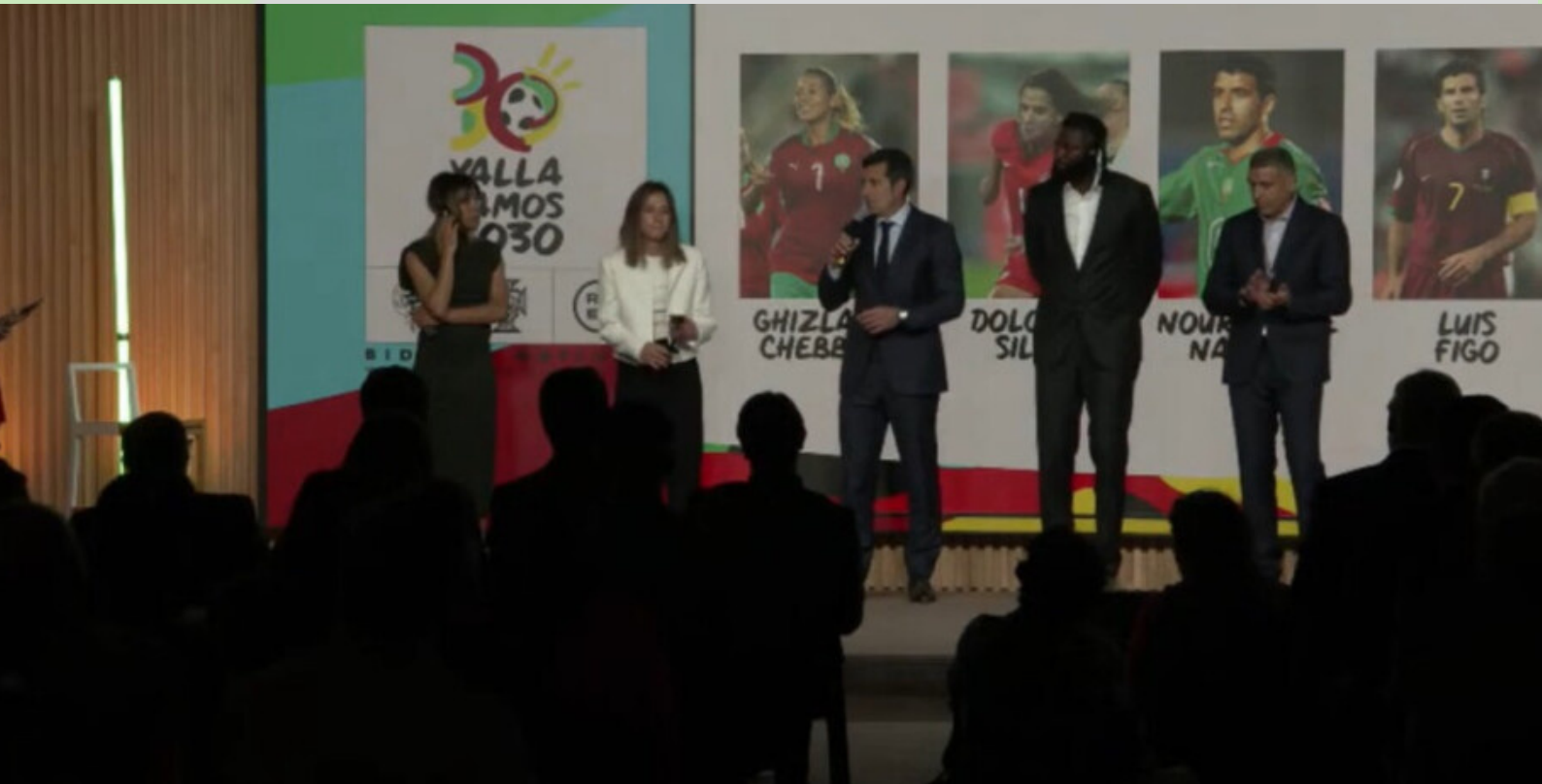
Mondial 2030 : la réaction des ambassadeurs de la candidature conjointe Maroc-Portugal-Espagne