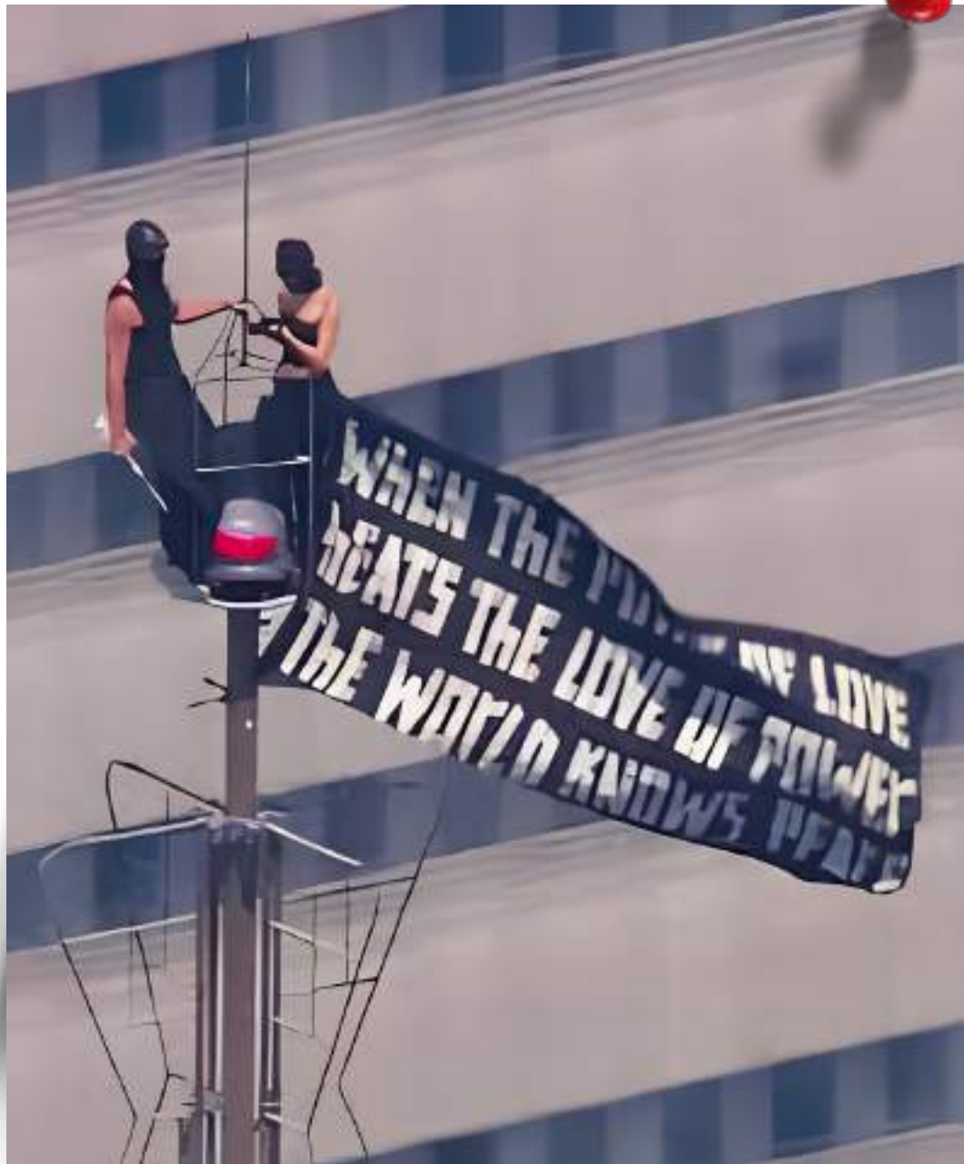
Un couple d'influenceurs escalade l'Empire State Building